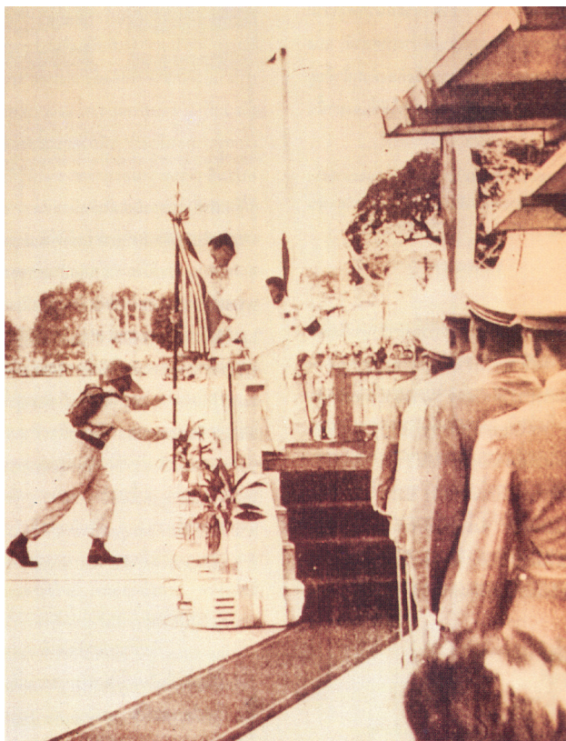
กิจการ อส.

นับตั้งแต่ได้มีการจัดตั้งกองอาสารักษาดินแดน เมื่อปี พ.ศ.2497 พระบาทสมเด็จพระเจ้าอยู่หัวได้ทรงมีพระมหากรุณาธิคุณต่อผู้บังคับบัญชา เจ้าหน้าที่ และสมาชิกกองอาสารักษาดินแดน นานัปการ ดังนี้