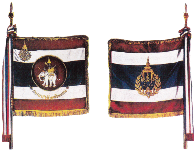
ธงประจำกองอาสารักษาดินแดน ด้านหน้าและด้านหลัง