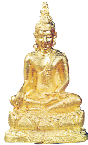
พระยอดธง

ภิเชกจนเสร็จพิธี ในวันที่ 21 มิถุนายน พ.ศ.2497 เวลาประมาณ 18.00 นาฬิกา