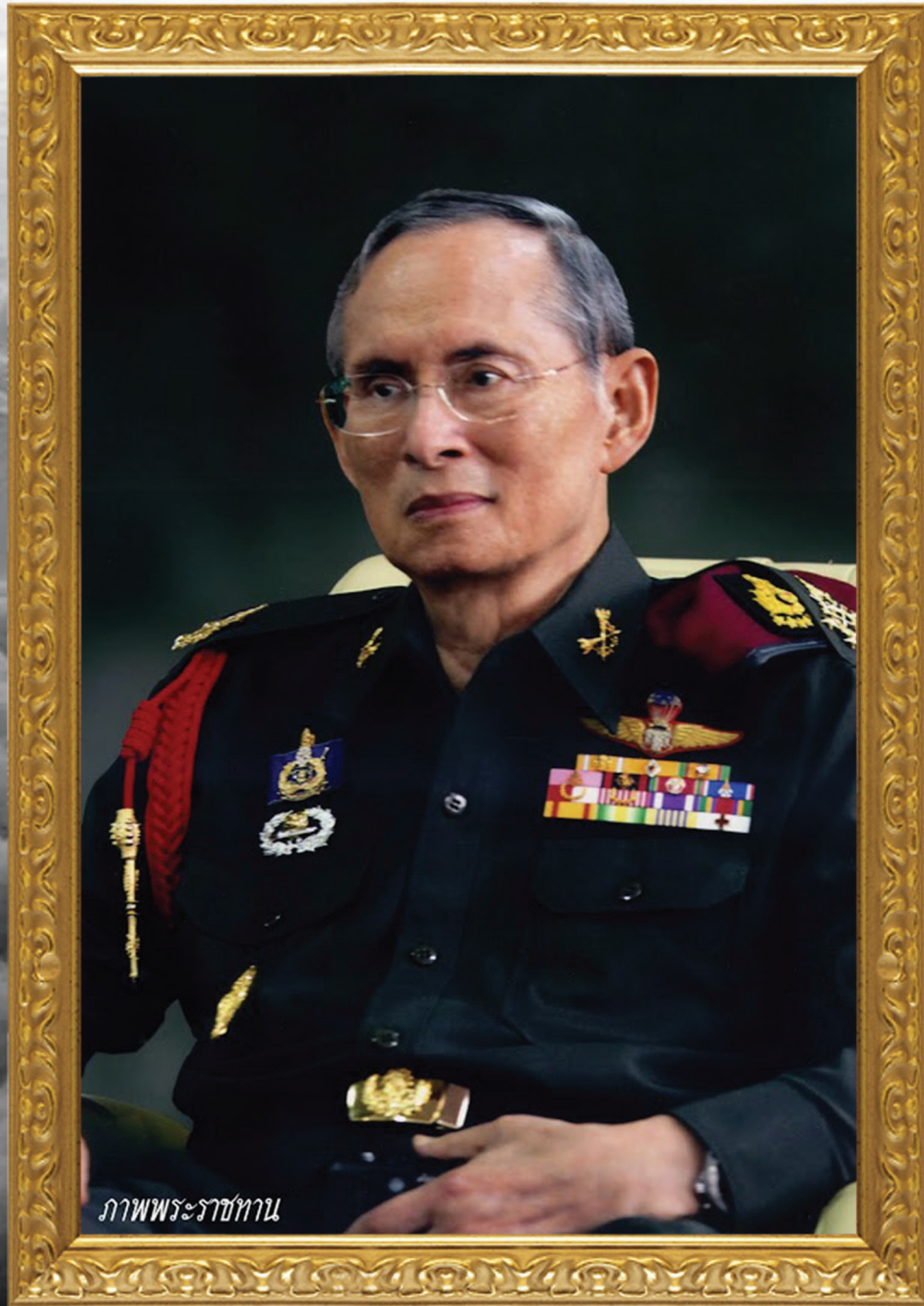
ภาพพระราชทาน